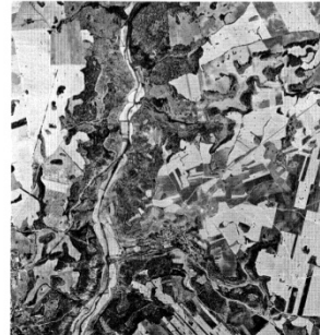
Olmeda de las Fuentes