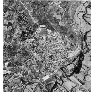
Orusco de Tajuña