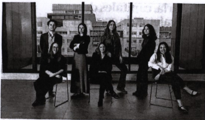
Alumnos ganadores del concurso

Las promesas de la arquitectura presentan sus propuestas para el rediseño del urbanismo en la capital, tras ser galardonadas por el programa municipal 'Sueña Madrid'