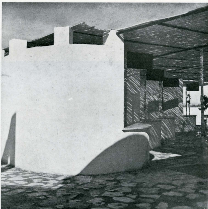
Conjunto y detalle del pabellón del Sindicato de la Vid.