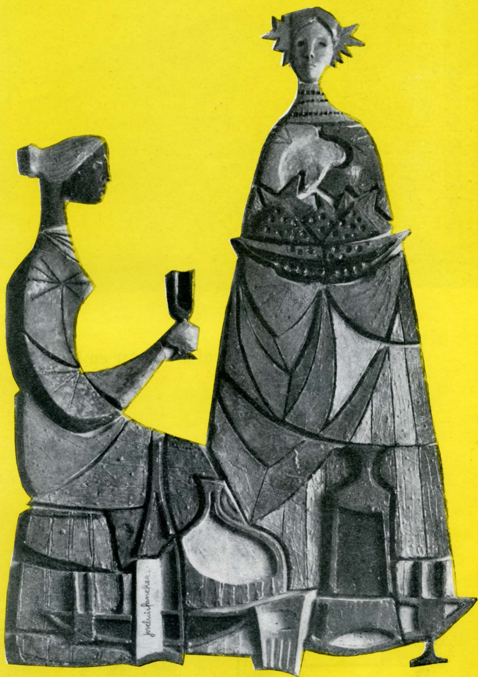
Elemento escultórico en barro co- zido y vidriado que decora la torre del pabellón de degustación de vino. Escultor: José L. Sánchez.