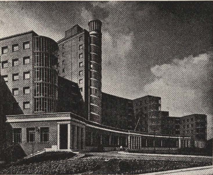
Vista de la fachada principal.