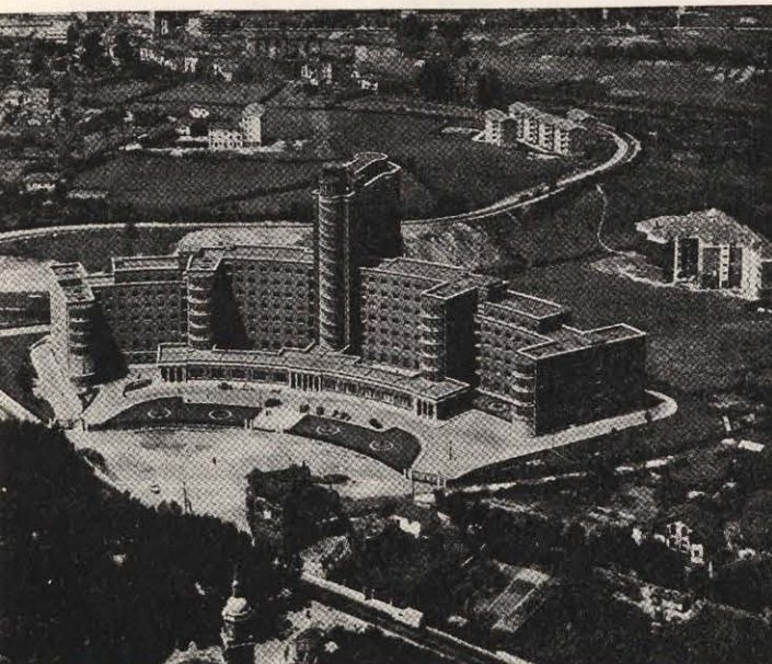
Vistas de conjunto.

En Bilbao se ha construído un Hospital de 650 camas, situado en Alto de Cruces, del Municipio de Baracaldo.