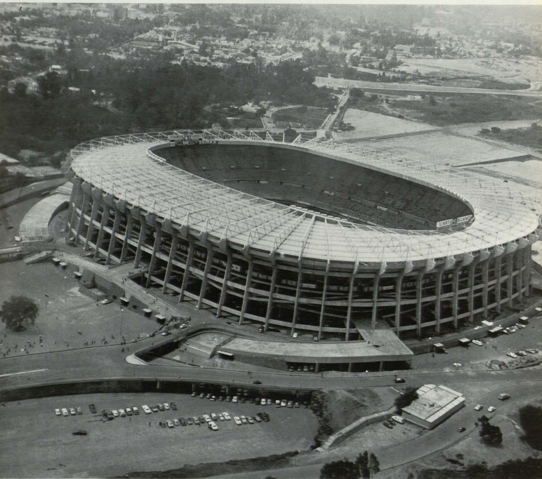
VISTA AEREA DEL ESTADIO AZTECA PARA COM- PETICIONES DE FUTBOL.