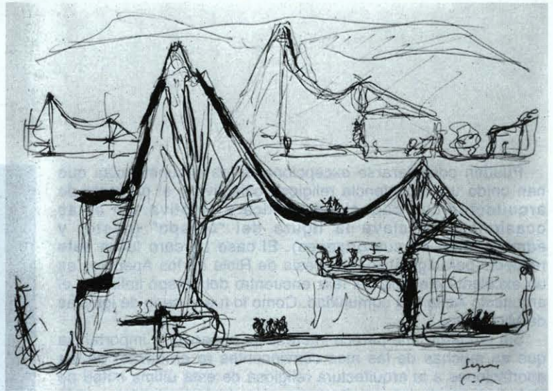
Giovanni Michelucci. Iglesia de San Juan Bautista "dell' autostrada". Florencia, 1961. Dibujos para el proyecto.