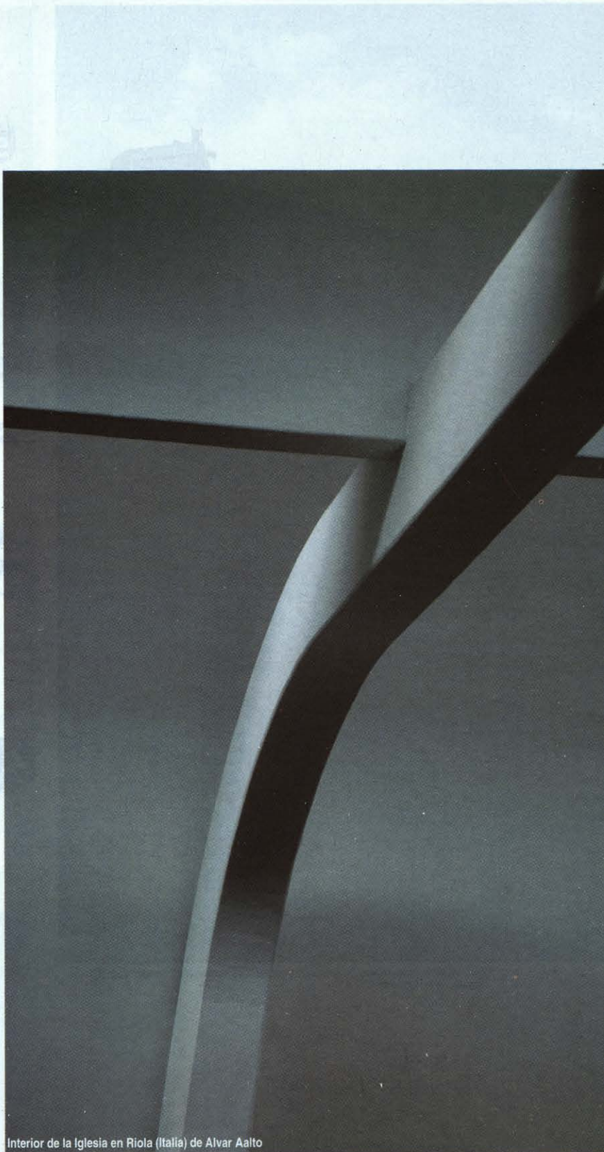
Interior de la Iglesia en Riola (Italia) de Alvar Aalto

Dada la extraordinaria oferta de formas arquitectónicas vigentes, la multiplicidad de actitudes de los propios arquitectos ante la concreción de su posible poética y la diversidad de opciones religiosas y su cambiante evolución, es seguramente a la autoridad religiosa a la que le toca elegir, proponer (el programa correcto, el arquitecto adecuado, el objetivo pertinente). En lo que más nos afecta –la elección del arquitecto–, con demasiada frecuencia parece observarse que no recae en la persona más capacitada. Como tampoco parece serlo quien elige. Para este último problema quizás sea buen remedio pedir consejo a quien puede darlo. Para la primera dificultad, una solución estaría en el ejercicio de la autocrítica. ¿Quién se considera suficientemente capaz de afrontar la responsabilidad de proyectar la iglesia? ¿Y de tener la fuerza moral suficiente para contribuir, con su propio proyecto, a la construcción de la iglesia?