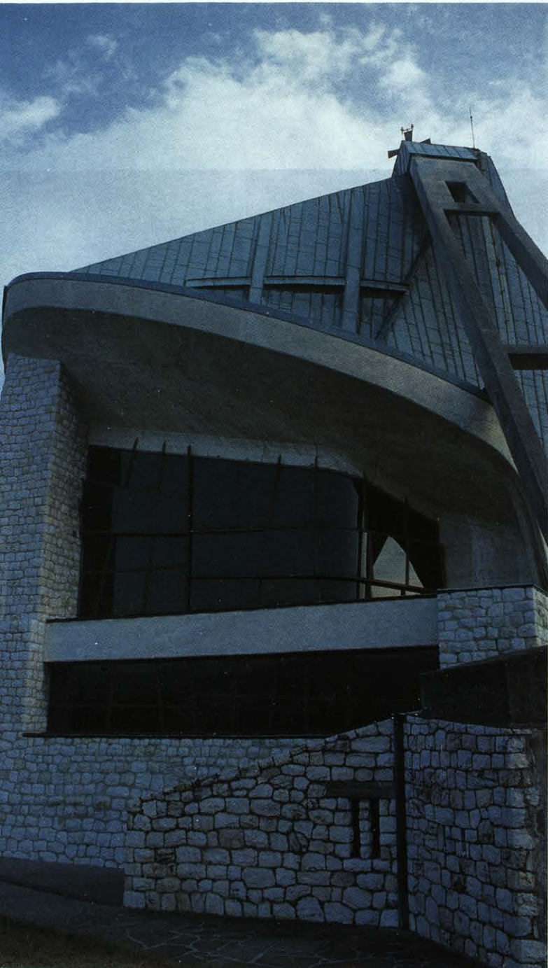
Giovanni Michelucci. Iglesia de San Juan Bautista "dell' autostrada". Florencia, 1961. Vista desde la autopista.