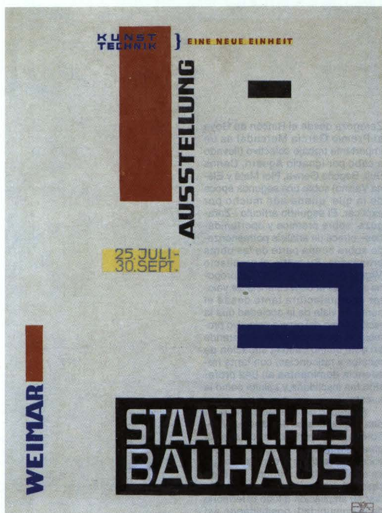
H. Bayer. Dibujo realizado para la Exposición de la Bauhaus, 1923.

ficios de Gropius: la nueva sede de la Escuela y las casas-atelier para los profesores. En el primero se aprecia cómo Gropius abandona las tradicionales disposiciones planimétricas, simétricas y encerradas en un perímetro unitario, para resolver el tema con una disposición dinámica, sin la jerarquías del delante y el detrás, del interior y exterior, negando la frontalidad y acentuando la percepción diagonal del edificio. El resultado es un edificio abierto, que para entenderlo hay que girar alrededor de él, obtenido con la técnica del montaje de distintas partes con características arquitectónicas bien definidas e identificables: el edificio de cuatro plantas acristalado de los laboratorios, el de las aulas de arquitectura, el puente entre ambos con las oficinas administrativas, y el de cinco plantas con las habitaciones y estudios para los estudiantes, unido a los anteriores a través de un cuerpo bajo, que contiene el refectorio y auditorio.