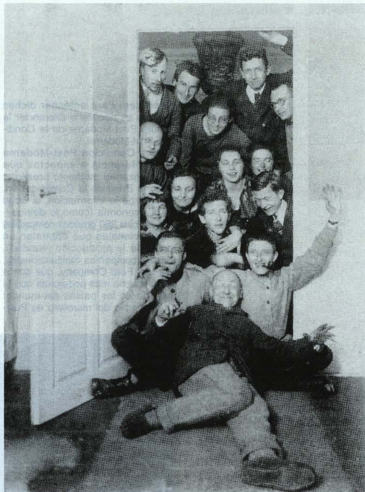
Profesores y estudiantes de la Bauhaus en Weimar, 1923.

la vez que se probaban los distintos materiales.