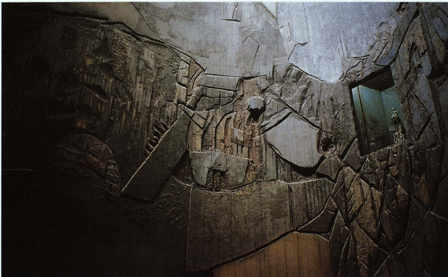
Retablo. Lucio Muñoz

En otro sentido, ese nuevo lenguaje establecería otros tiempos de percepción, de aprehensión, otras medidas, otras referencias que le permitirían diferenciarse, lograr una identidad propia, contextualizándose definitivamente en un tiempo y en un lugar, significándose como la expresión moderna de la arquitectura religiosa. Es muy posible que no llegasen a existir unos acuerdos, unos códigos formales comunes; pero es indudable que se consiguió un estilo común, un estilo basado en la conducta, en la conciencia de libertad, que provocaba que la sinceridad, tanto de la concepción estructural, del uso de la materia como del ejercicio del oficio para tratarla, para formalizarla, fuera la base de todo ese conglomerado artístico. Son materiales presentados en su digna rudeza original, en su natural expresividad, sin ningún tipo de camuflaje, en búsqueda de lo esencial, omitiendo detalles y accidentes, huyendo de la acumulación, revelando una vez más lo esencial, potenciando la economía y la sobriedad; revelando el proceso creativo, dejando las huellas, los gestos de esos convulsivos momentos, en la materia cruda. Y eso, ocurriendo simultáneamente en todas las disciplinas artísticas, desde la forma específicamente arquitectónica, pasando por el gesto escultural hasta terminar en lo primario del uso de los colores por la pintura, estableciendo en último caso un pulso entre el acontecimiento artístico y el acontecimiento natural.