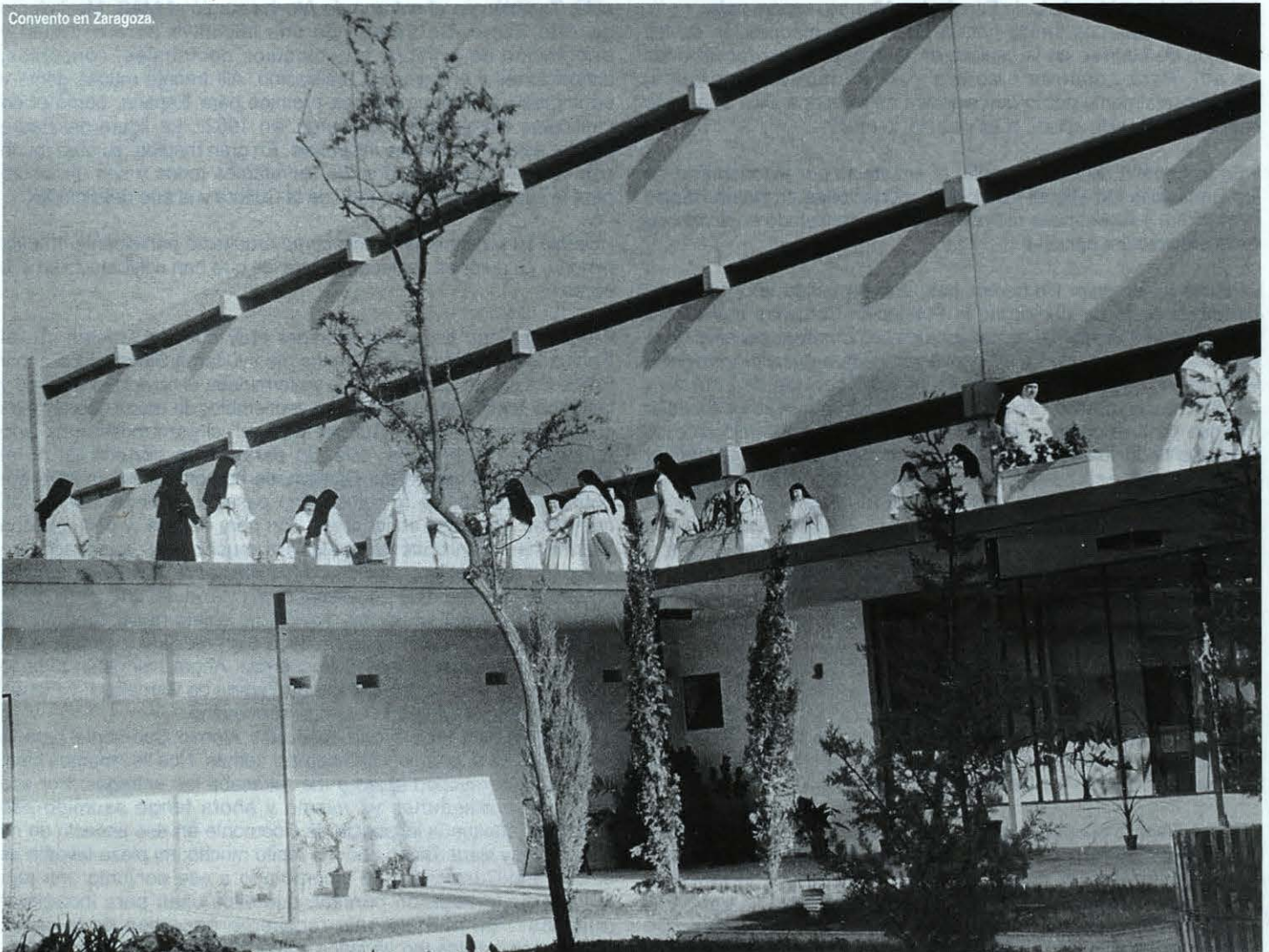
Convento en Zaragoza.

- Así lo creo. Desde hace siglos, la tipología dominicana en arquitectura es muy elemental, sintética; podríamos decir que anticipa la modernidad. Se trata de un pabellón lineal, orientado a mediodía, donde se distribuyen todas las funciones que requieren sol -luz y calor-; a su espalda se organiza otra pastilla con el resto de las funciones: el refectorio, la iglesia, etc... Tuve un gran disgusto en Salamanca cuando alguien, al ampliar el convento dominicano de Alba de Tormes, que respondía a las anteriores características y que presentaba incluso en el remate de cubierta el arranque de un segundo piso, como invitando desde el siglo XVI a ser completado de esa manera, fue violentado con una pastilla perpendicular -¡de cristal!-, y en consecuencia con orientaciones levante y poniente. Tengo muy buenos amigos entre los jesuitas; pero me parece que su fijación tipológica se produjo en un momento de decadencia del barroco y es mucho menos interesante. Es una fijación más formal que la dominicana; por eso su aportación en el terreno de la arquitectura ha sido históricamente más apagada... ■