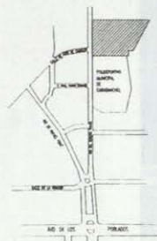
ESQUEMA DE EMPLAZAMIENTO

Existen dos accesos al recinto: uno, peatonal, situado en el sur de la parcela en la avenida del General Fanjul; y otro, de vehículos, en la zona oeste que sirve de entrada al recinto del pequeño aparcamiento y posibilita el abastecimiento de las distintas instalaciones. ■