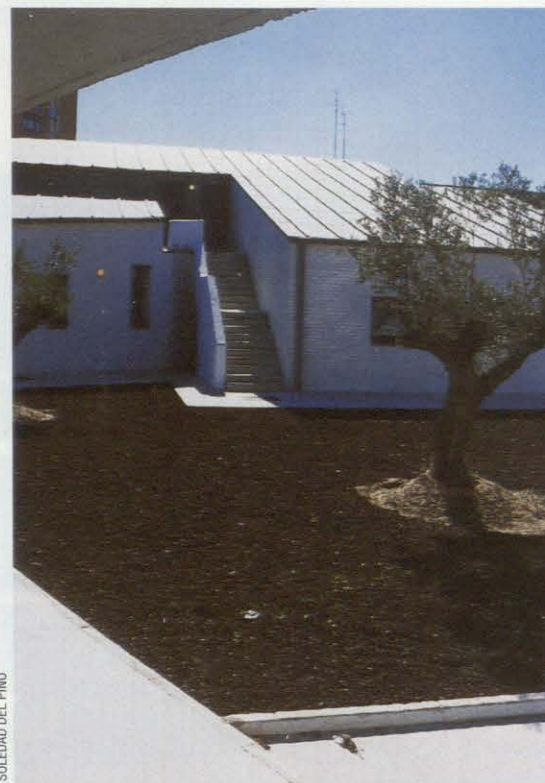
SOLEDAD DEL PINO