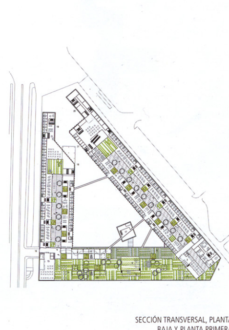
SECCIÓN TRANSVERSAL, PLANTA BAJA Y PLANTA PRIMERA

Lo que es preexistente en este lugar es un complejo de naves de principios del siglo XX que forman un particular vacío en su interior, permitiendo una emocionante libertad espacial que consideramos importante conservar.