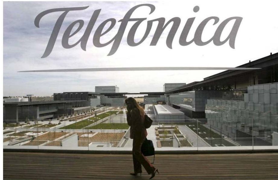
Imagen de Distrito C, la sede corporativa de Telefónica.

El cambio contable que obliga a computar el alquiler como deuda ha dado un vuelco al mercado de oficinas, porque pone en valor tener los cuarteles generales en propiedad